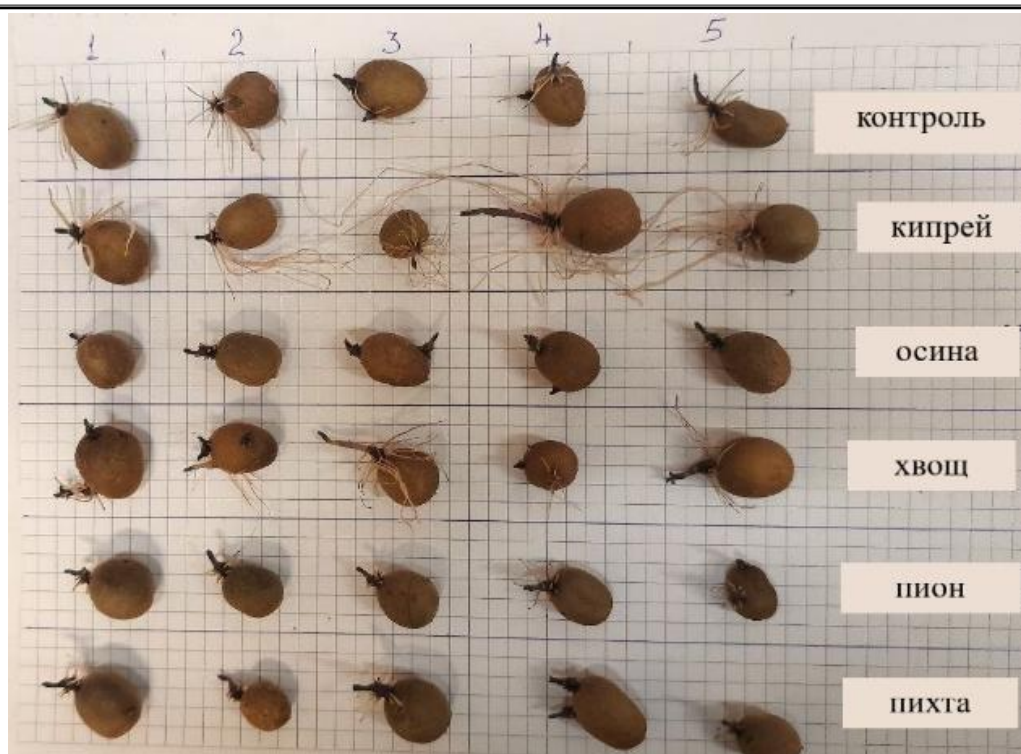
Рис. 1. Фотография клубней на 39-е сут эксперимента A photograph of the tubers on day 39 of the experiment

Для оценки достоверности различий между вариантами обработки и контролем применяли непараметрический U-критерий Манна – Уитни. Расчеты выполняли в программе MS Excel с использованием стандартных статистических функций. Различия считали статистически значимыми при p < 0,05 , высокозначимыми – при p < 0,01 . В таблице и на графиках данные представлены как средние арифметические значения по 5 повторностям. Для наглядности динамики прорастания построены столбчатые диа-