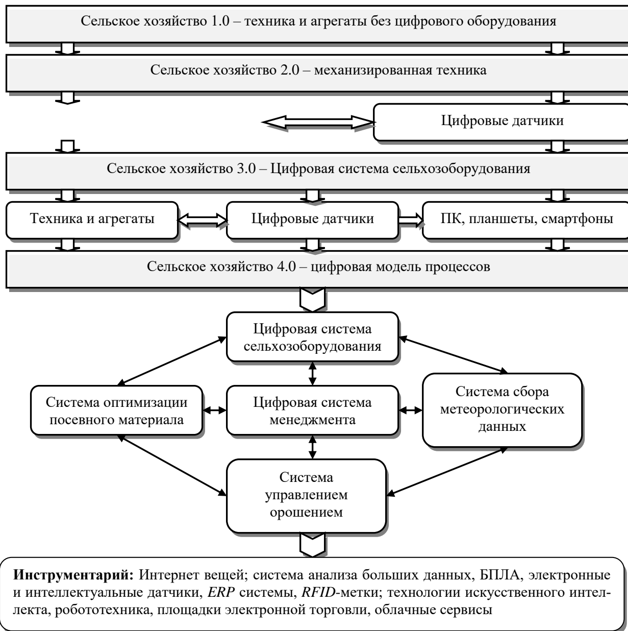
Рис. 2. Этапы развития цифровизации сельскохозяйственных предприятий (составлено автором)

Третья стадия – завершающая. На данной стадии мониторинг состояния почв полностью роботизирован; фитосанитарное состояние растений полностью контролируется с помощью БПЛА; большинство процессов хранения готовой продукции роботизировано и цифровизировано; процессы стратегического и оперативного менеджмента хозяйствующего субъекта осуществляются с помощью цифрового анализа больших данных на основе омниканальности; широко