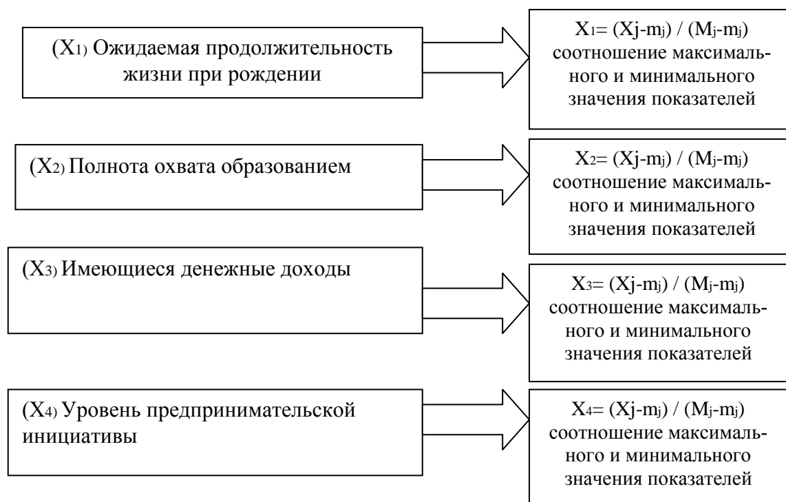
Рис. 1. Критерии количественной оценки уровня человеческого капитала

Учитывая специфику сельских территорий, в качестве оценочного индикатора индекса реального ВВП, нами предложено использовать показатель располагаемых денежных доходов, а также индикатор предпринимательской инициативы (рис. 1, табл. 1).