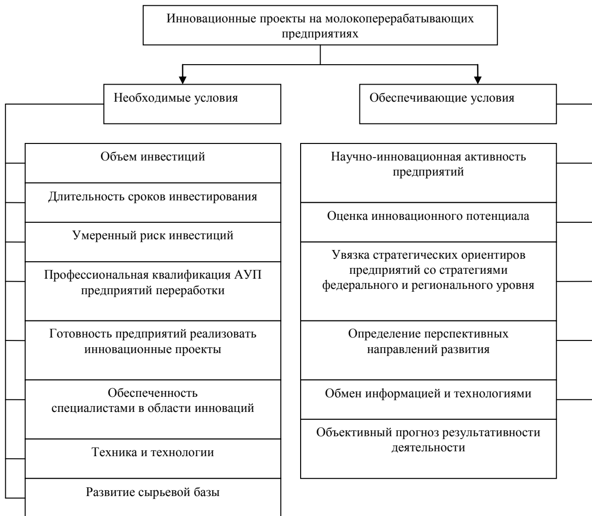
Рис. 1. Необходимые и обеспечивающие условия реализации иновационных проектов

Среди необходимых условий эффективной работы механизма управления, реализация иновационных проектов без которых невозможна, по нашему мнению, наибольшее значение имеют такие условия, как объем инвестиций, техника и технологии и обеспеченность специалистами в области иноваций. Среди обеспечивающих, которые значительно увеличивают эффективность управления иновационной деятельностью, следует выделить такие условия, как увязка стратегических ориентиров предприятий со стратегиями федерального и регионального уровня, обмен информацией и технологиями, научно-иновационная активность предприятий.