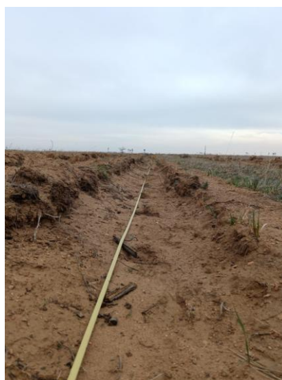
Рис. 3. Минерализованные борозды с саженцами Pinus sylvestris на ПП 5 заказника «Цасучейский бор» Mineralized furrows with Pinus sylvestris seedlings at PP 5 of the Nature Reserve «Tsasucheysky Bor»