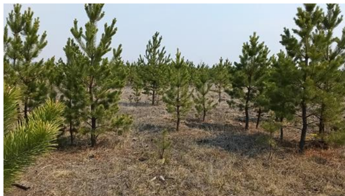
Рис. 2. Естественное возобновление Pinus sylvestris на ПП 3 заказника «Цасучейский бор» Natural regeneration of Pinus sylvestris in the Nature Reserve «Tsasucheysky Bor»