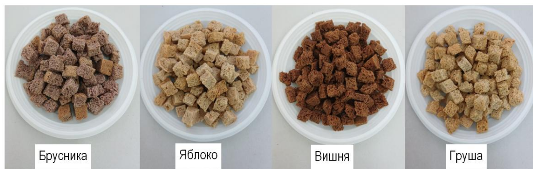
Рис. 3. Сухарные изделия с порошковыми продуктами из плодово-ягодных жмыхов (10,0 %) Breadcrumbs with the powdered products from fruit and berry cakes (10,0 %)

Здесь и далее: ССХИ – свойственный для сухарных хлебобулочных изделий.