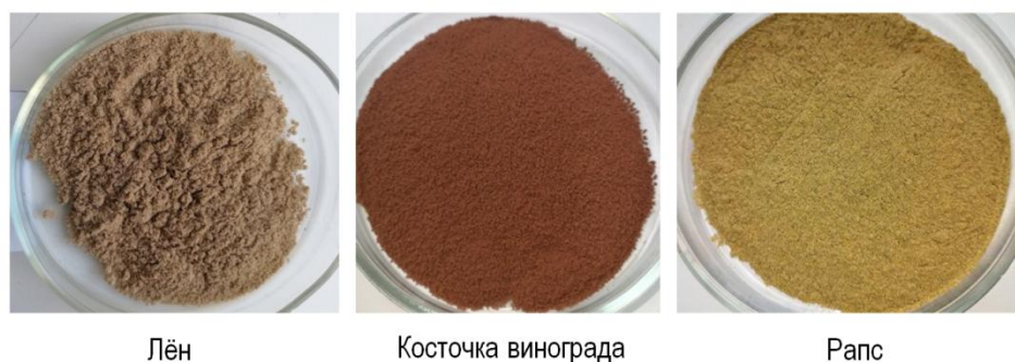
Рис. 1. Порошки из продуктов переработки семян Powers from seed processing products

Для лучшего измельчения все жмыхи высушивались до постоянной влажности в сушильном шкафу ШС-2/80-СПУ (Смоленское СКТБ СПУ, Россия) при температуре 60–70 °С. После окончания сушки выполнялось непосредственно измельчение растительного материала при помощи лабораторной мельницы ЛМ-202 (ООО «Плаун», Россия). Измельченный продукт разделялся на фракции посредством отсева лабораторного РЛ-5МЦ (ООО «НПП «Приборинформ», Россия). В последующем процессе производства сухарных изделий использовалась фракция с размером 100–200 микрон. Примеры готовых порошковых продуктов даны на рисунке 1.