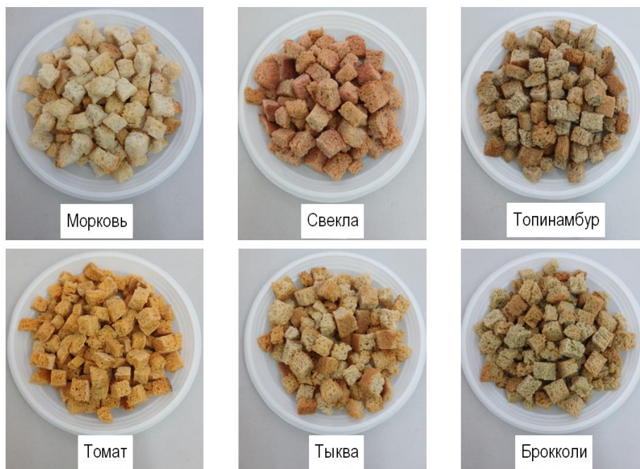
Рис. 4. Сухарные изделия с порошковыми продуктами из овощных жмыхов (10,0 %) Breadcrumbs with the powdered products from vegetable cakes (10,0 %)

Отчасти сопоставимые результаты обогащения сухарных хлебобулочных изделий были получены и при введении в рецептуру продуктов переработки семян льна, рапса и косточки винограда (табл. 5). Полученные изделия отличались приобретением цветовых и вкусоароматических характеристик добавок. При этом замена 20 % муки пшеничной хлебопекарной высшего сорта порошковыми продуктами способствовала появлению у изделий уплотнений и пустот, что главным образом объясняется высокой влагоудерживающей способностью применяемых порошков, определяемой значительным содержанием в них гидрофильных веществ, представленных белками, полисахаридами и т. д. Этот же фактор определяет повышение влажности изделий при использовании порошков продуктов переработки семян: у образцов с 10,0 % порошков – косточка винограда (↑7,9%) → лен