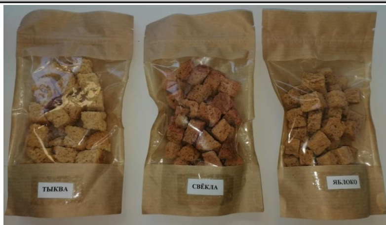
Рис. 6. Вариант упаковки готовой продукции в крафт-пакеты The option of packaging finished products in kraft bags

Примечательно, что сухарные хлебулочные изделия являются одним из самых популярных видов продукции, выпускаемой хлебопекарными предприятиями по всему миру, которые при этом преимущественно изготавливаются из рафинированной пшеничной муки, характеризующейся наименьшей пищевой ценностью для человека [17, 21]. Анализ современной научной литературы показывает, что для улучшения пищевых характеристик сухарных хлебулочных изделий могут применяться самые разнообразные материалы [22]. Так, ученые Алтайского ГТУ им. И.И. Ползунова условно выделили 4 основных вида безглютенового сырья, активно используемого в хлебопекарной промышленности: 1) мука с высоким содержанием полисахаридов; 2) ингредиенты с высоким содержанием белка; 3) гидроколлоиды; 4) эмульгаторы, разрыхлители, вкусоароматические ингредиенты. Применение многих вышеперечисленных материалов позволяет значительно повысить не только потребительские, но и прежде всего функциональные характеристики продукции [23]. Существенным положительным воздействием на пищевую ценность сухарных хлебулочных изделий из пшеничной муки отличаются различные порошковидные материалы, в частности вырабатываемые из плодово-овощного сырья [9] и продуктов переработки маслосемян [24, 25]. Важное место в повышении пищевой ценности сдобных сухарей имеют пюреобразные продукты (например из тыквы) [7]. Известны также примеры использования в рецептурах сухарных изделий специально подготовленных комплексных улучшителей [26].