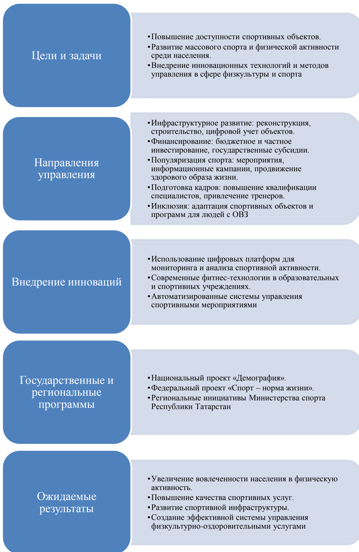
Рис. 3. Концепция управления продвижением физкультурно-оздоровительных и спортивных услуг [8]