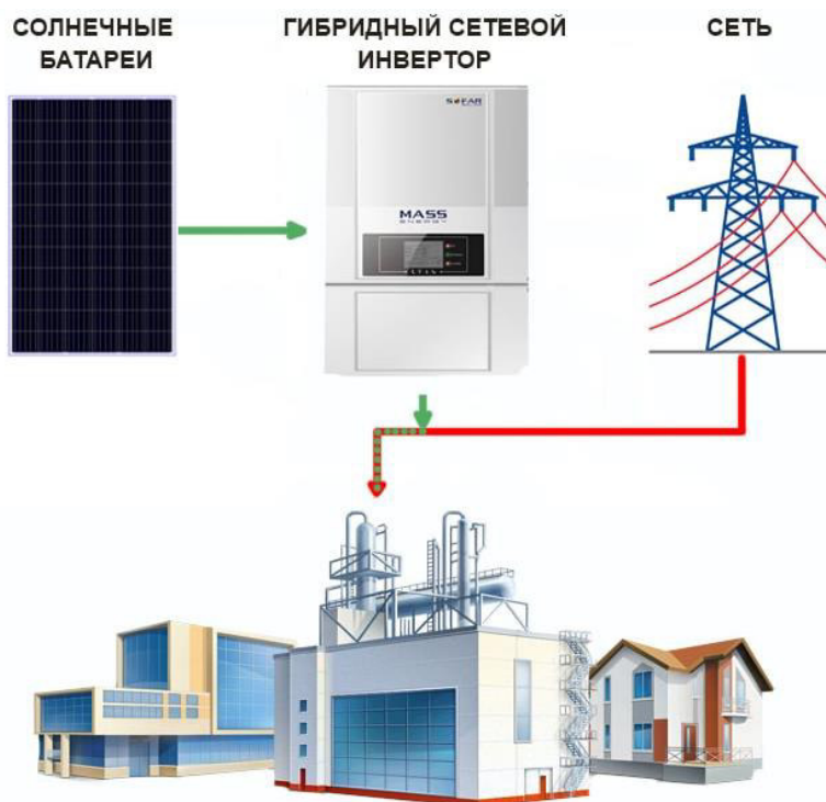
Рис. 2. Структурная схема сетевой фотоэлектрической станции от компании «Технолайн» [6]

Типовой состав оборудования сетевой ФЭС. Все сетевые ФЭС строятся на одном принципе, как правило, состоят из однотипного набора оборудования, которое включает [8–11]: