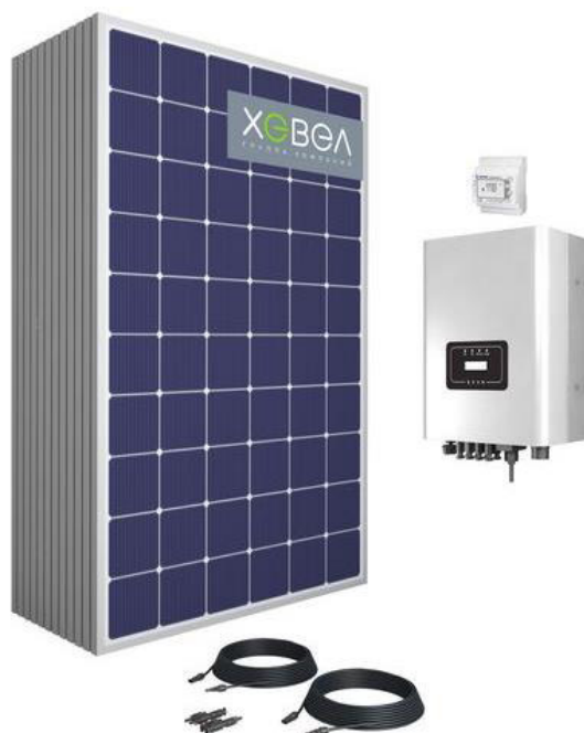
Рис. 1. Общий вид комплекта сетевой фотоэлектрической станции Хевел С5-DH мощностью 15 кВт

В линейке сетевых ФЭС от «Технолайн» имеются электростанции мощностью от 15 до 60 кВт [9], некоторые из них представлены в таблице 2.